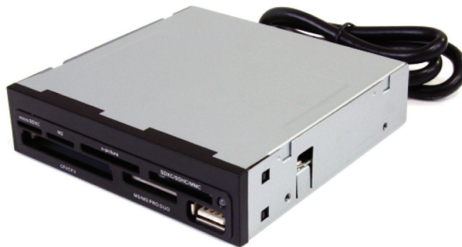
*Tatsächliches Produkt kann von den Fotos abweichen