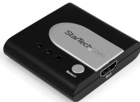
*El producto real podría variar de la fotografía

El Conmutador de vídeo permite alternar manualmente de un puerto a otro, presionando el botón "Select" (Seleccionar) ubicado en la parte superior de la unidad. La selección se mantendrá activa hasta que la señal de vídeo del Puerto 1 cambie, regresando el Conmutador a modo automático.