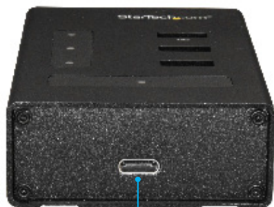
USB Type-C™ ポート (データのみ)