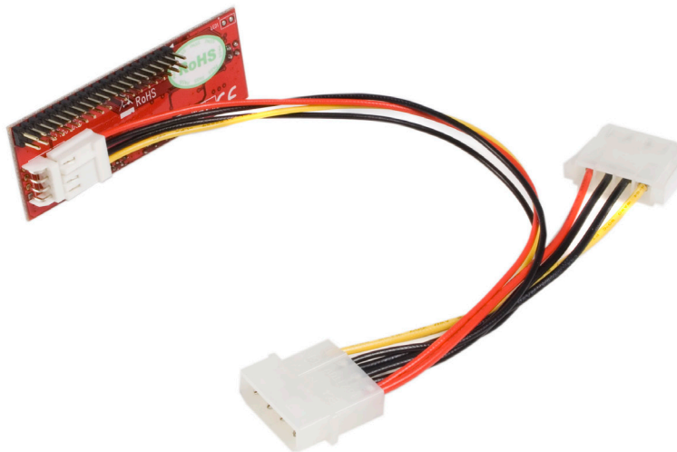
*Tatsächliches Produkt kann von den Fotos abweichen