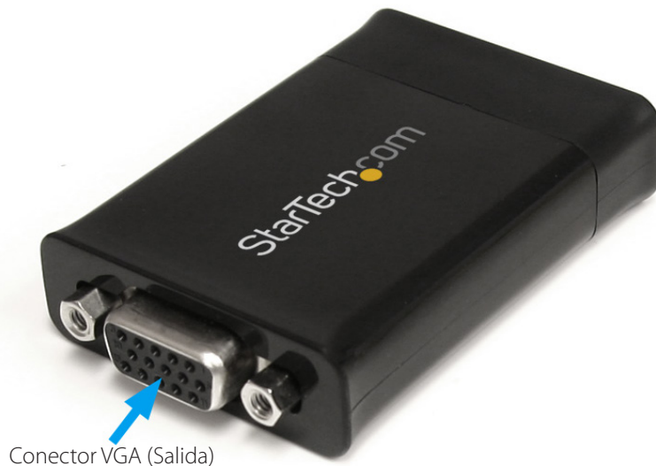
Conector VGA (Salida)

*El producto real podría variar de la fotografía