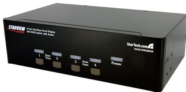
*El producto real podría variar de la fotografía