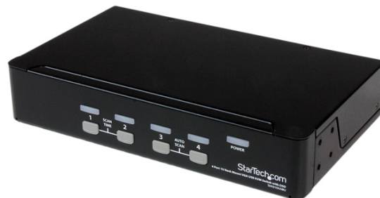
*El producto real podría variar de la fotografía