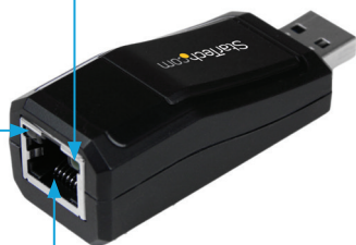
Gigabit Ethernet RJ45 メス