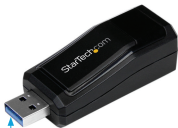
USB 3.0 Aタイプ オス