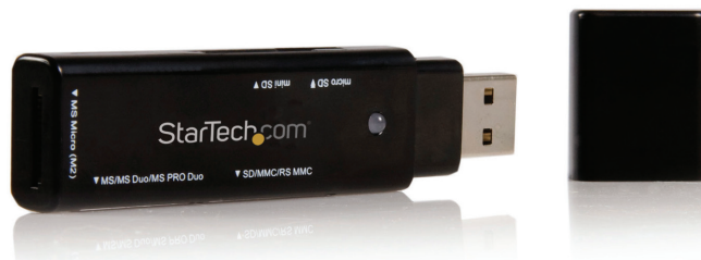
*El producto puede variar del de la fotografía