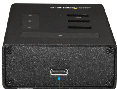
USB Type-C™ ポート (データのみのみ)