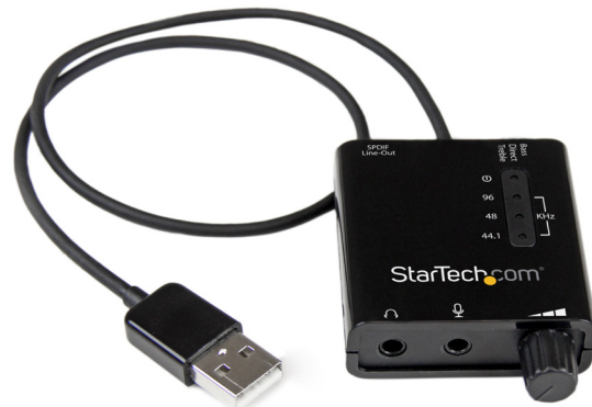
*El producto real podría variar de la fotografía

NOTA: Si no se produce entrada/salida de sonido del dispositivo al conectarlo, verifique la configuración de audio de su PC, con el fin de asegurarse que está debidamente ajustada para utilizar el Adaptador como un dispositivo de entrada/salida de sonido.