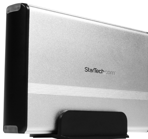
*El producto real podría variar de la fotografía