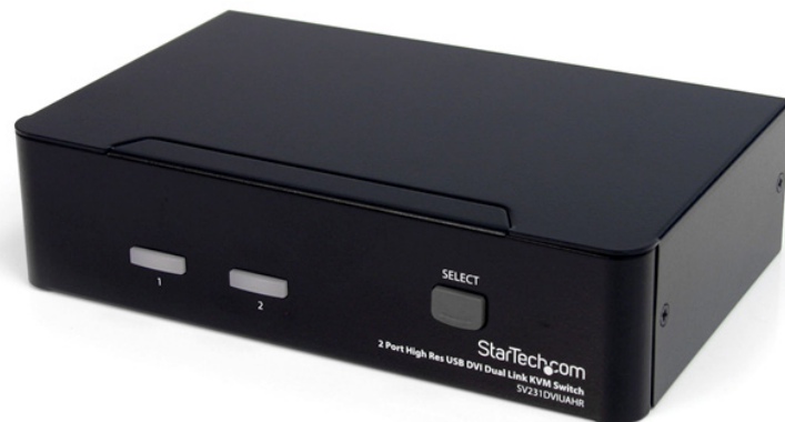
*El producto real podría variar de la fotografía