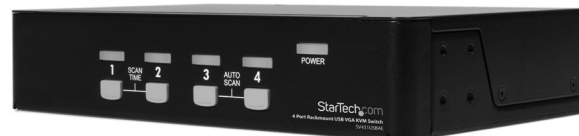
*El producto real podría variar de la fotografía