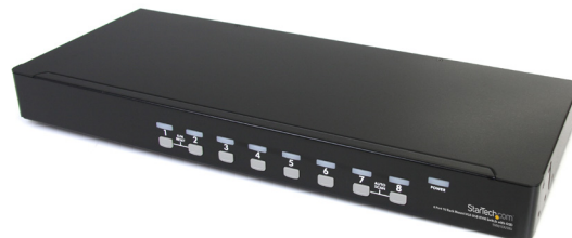
*El producto real podría variar de la fotografía