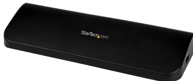
*El producto real podría variar de la fotografía